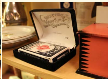
Magi-Arkivet finns i en källar-lokal i centrala Nyköping.